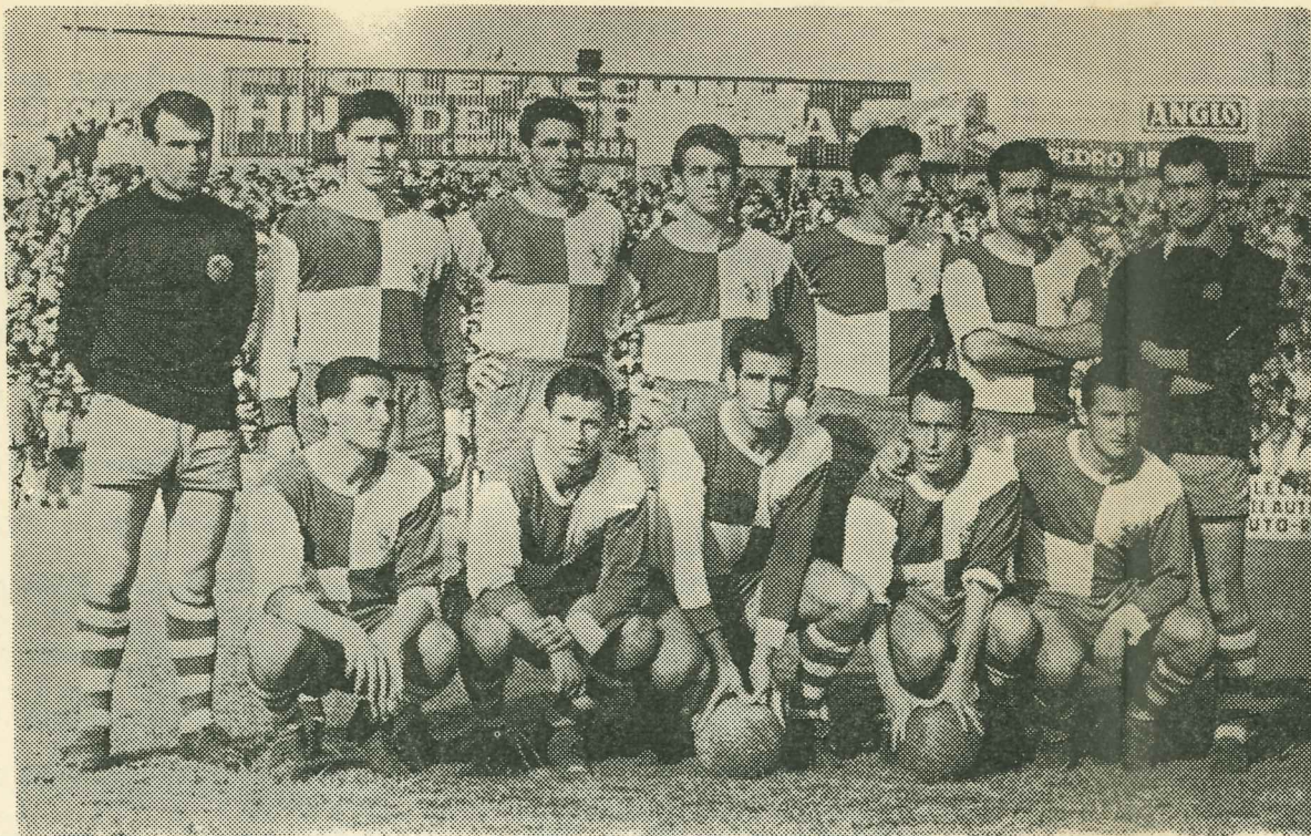
El equipo, forjador de la proeza