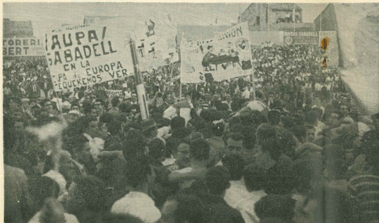
Entusiasmo delirante, tras la victoria, en la Creu Alta