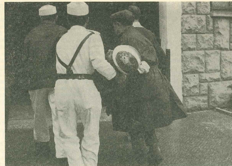
Primeros auxilios desesperados a una vida que se extingue. El casco roto, el cuerpo inanimado.... nada pudo la ciencia ante la gravedad del accidente